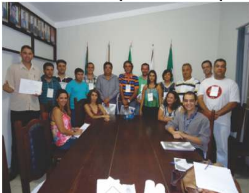
Participantes do Curso

A Associação Comercial e Empresarial de Campo Belo em parceria com o Sebrae/MG realizou nos dias 12,13 e 14/04 o Curso Como Conduzir Negociações Eficazes nas dependências da entidade. O Curso apresenta técnicas que permitem identificar os fatores que influencia uma negociação, vivenciar as fases de uma negociação, identificar o próprio perfil e do outro negociador, conhecer a importância da relação “ganha-ganha” e o fortalecimento de parcerias, de forma a aplicá-las no seu dia a dia empresarial, conduzindo negociações eficazes. É voltado a empresários e gestores de pequeno negócio.